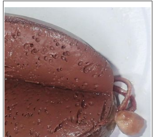
Poren in den Würsten 2018: Vom Schlagrahm ? Oder kommt das von den Zwiebeln ?