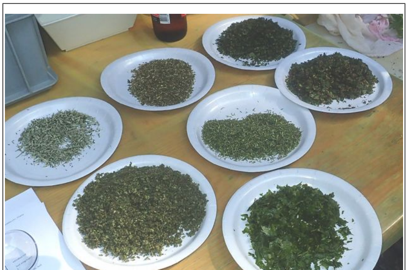
Gehackte Frischkräuter Majoran, Thymian, Rosmarin, Salbei, Maggikraut (eher zurückhaltend begeben), Currykraut die ansonsten grosszügig zugegeben wurden (2018, 20 lt Blutwurst, 17 kg Leberwurst)