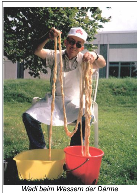
Wädi beim Wässern der Därme

Benzinvergaser ja, die können sicher auch schöne Stichflammen oder Explosionen erzeugen.