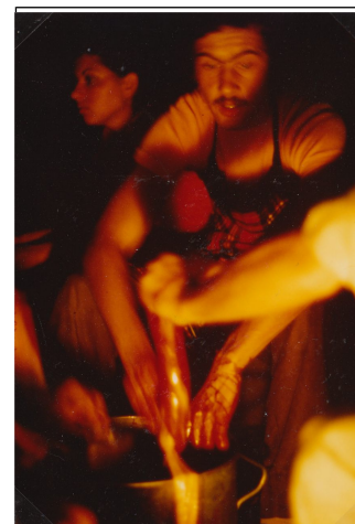
1974 Forsthütte Rüschlikon