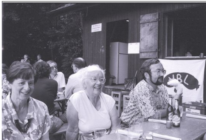
Sommermetzgete 1991 in Birmensdorf